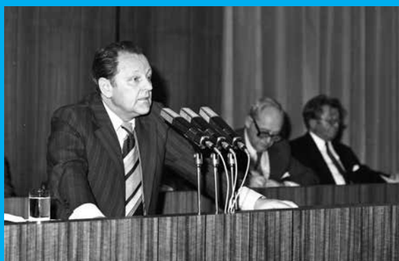
Miloš Jakeš, člen Predsedníctva a tajomník ÚV KSCN na zasadnutí ÚV KSCN 3. decembra 1985 v Bratislave.