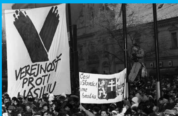
Pohľad na účastníkov mítingu na námestí SNP v Bratislave 12. januára 1990 pri príležitosti oficiálnej pracovnej návštevy prezidenta ČSSR Václava Havla.