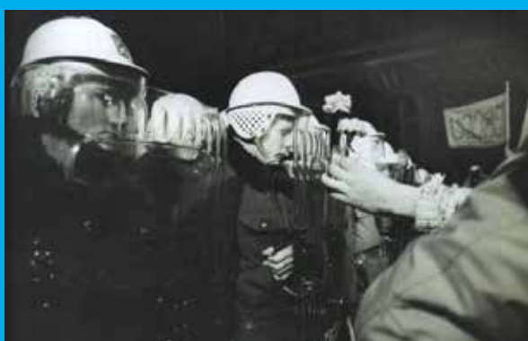
Bezpečnostné zložky a študenti s kvetmi na demonstrácii 17. novembra 1989 v Prahe.